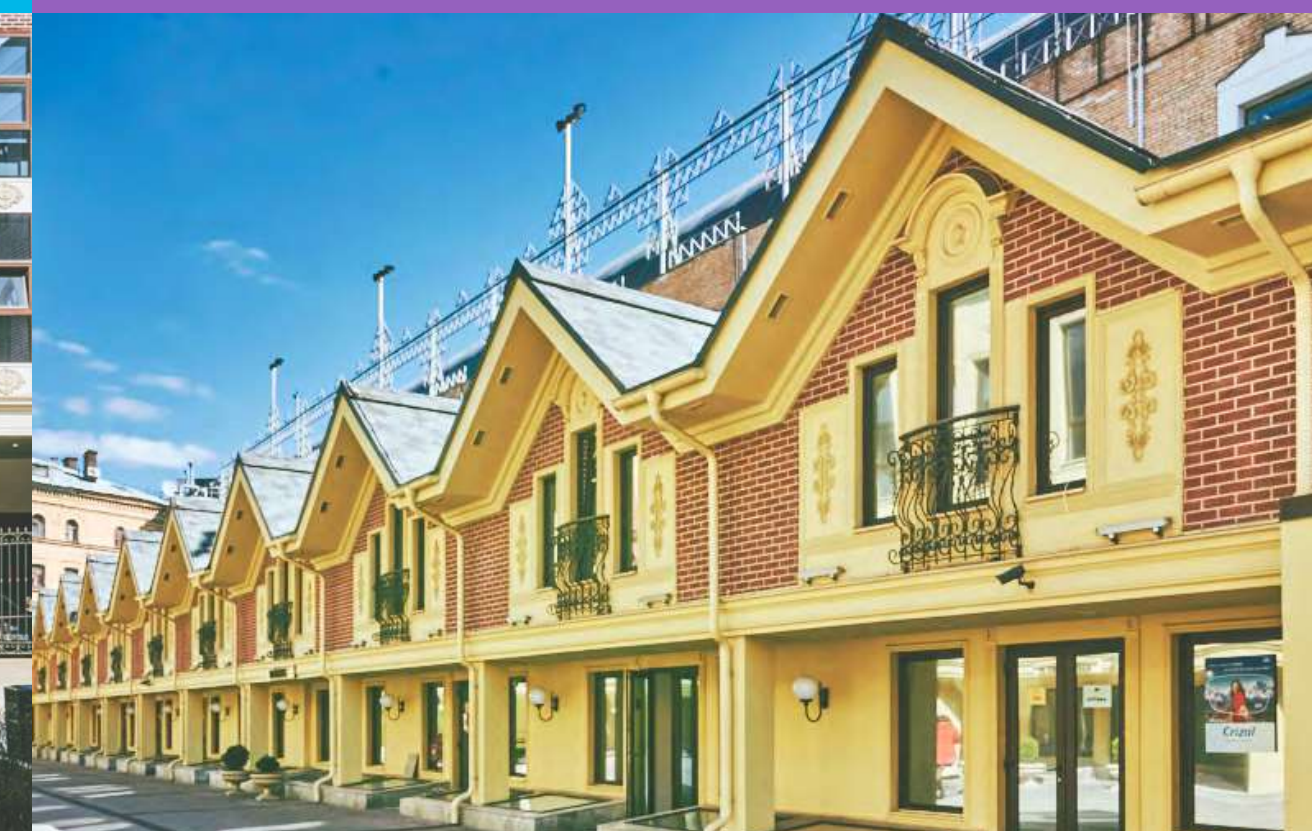
комплекс особняков Central Street