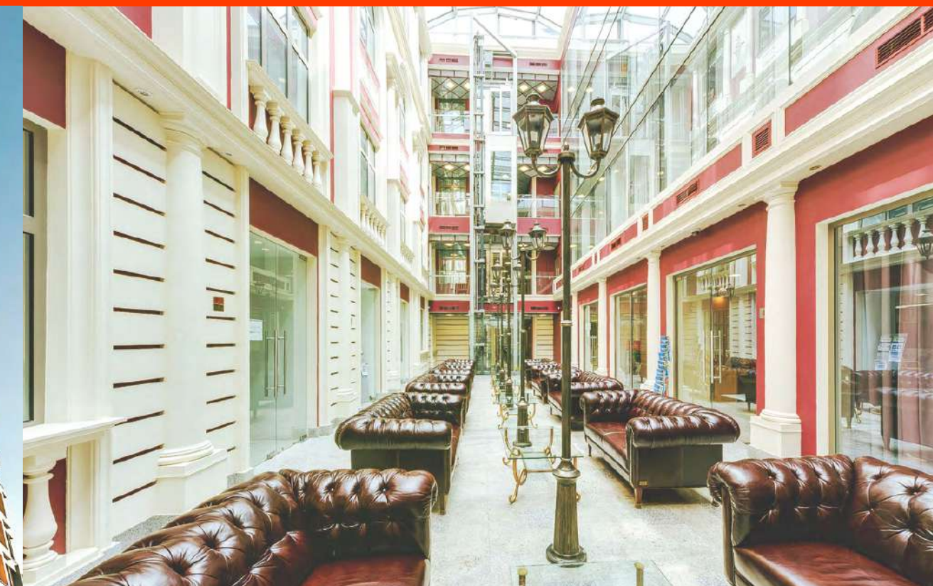
клубный бизнес-центр «Цветной 26»