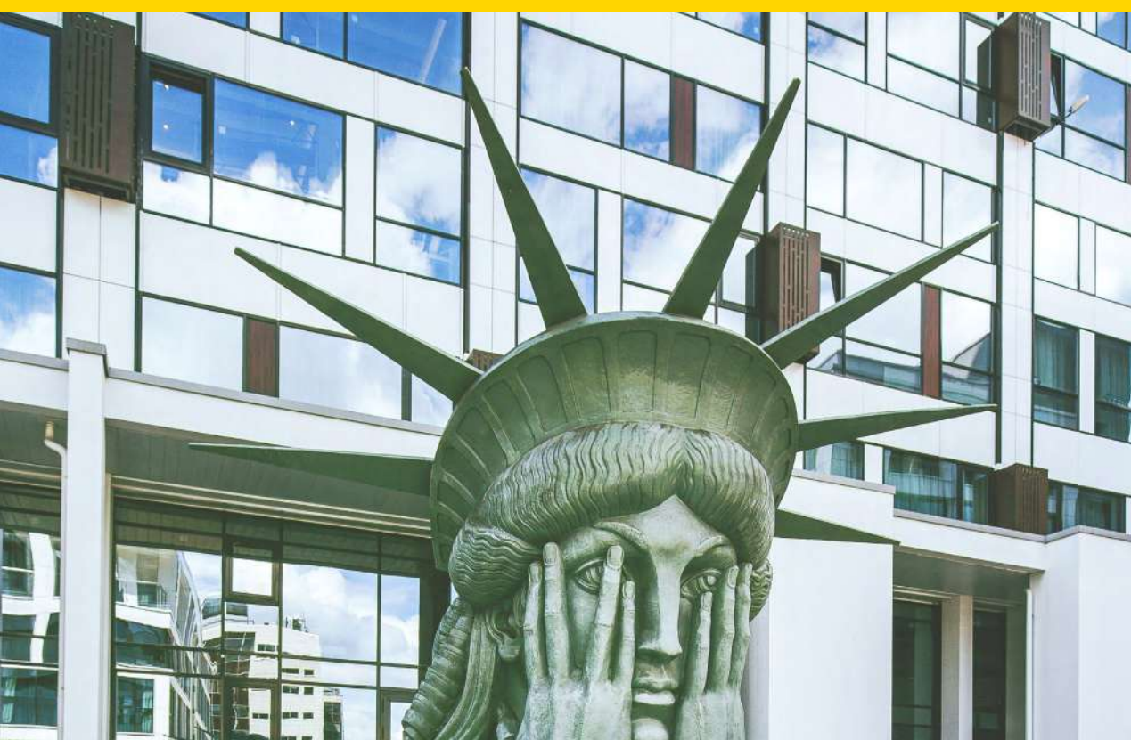
апарт-квартал TriBeCa Apartments