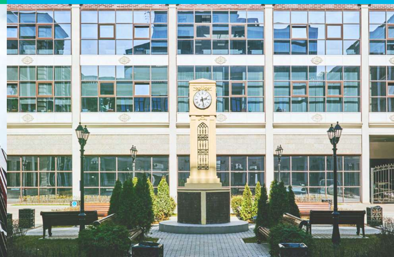
клубный деловой центр Central Yard