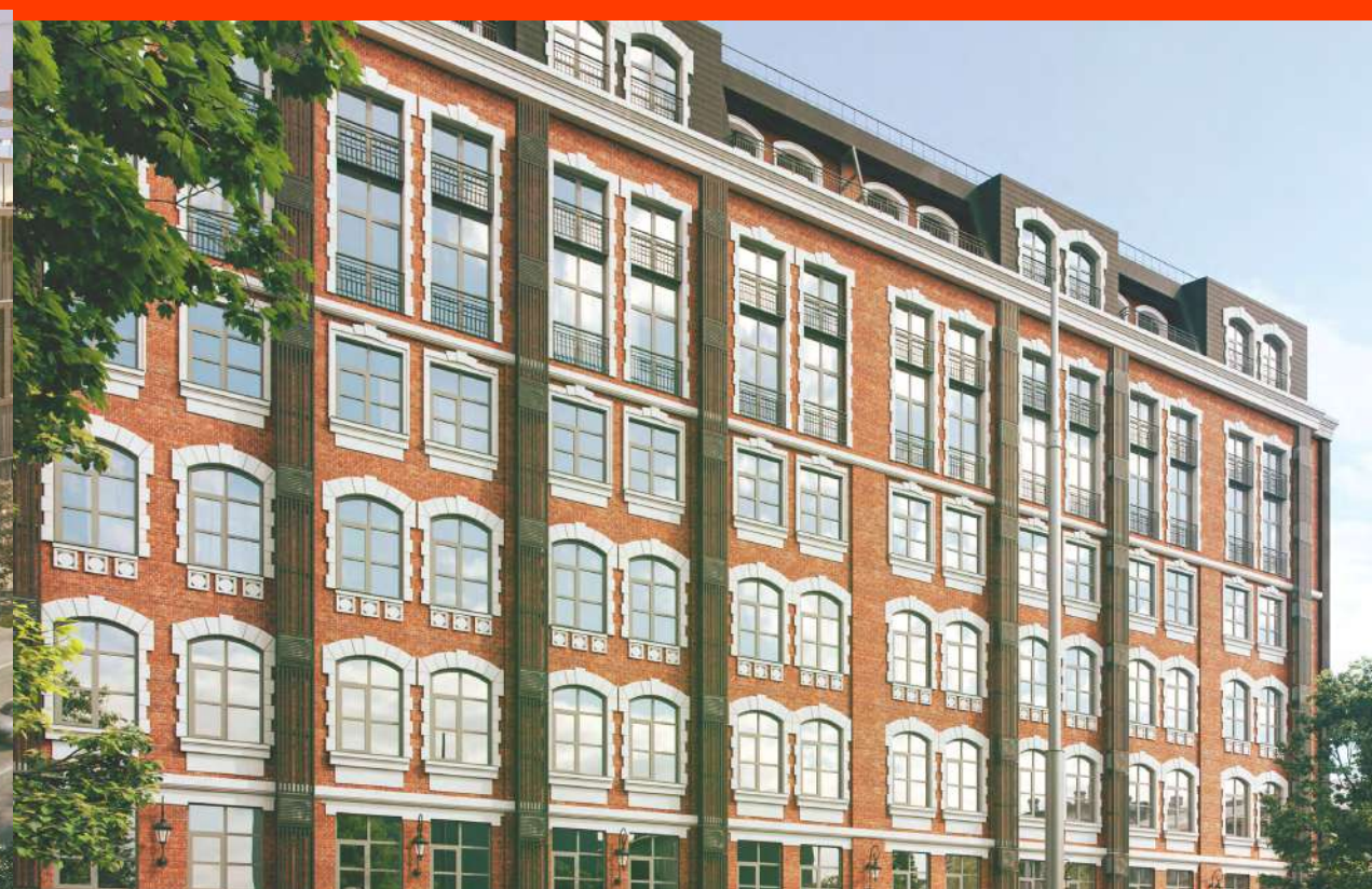
комплекс лофт-апартаментов KleinHouse