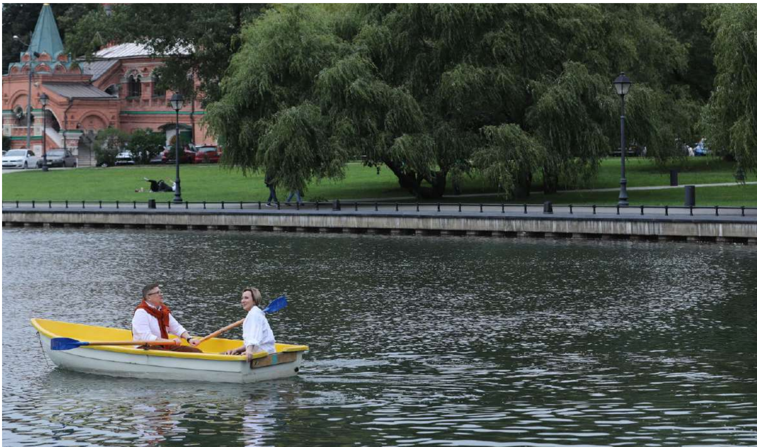
ОТДЫХ В ПАРКЕ